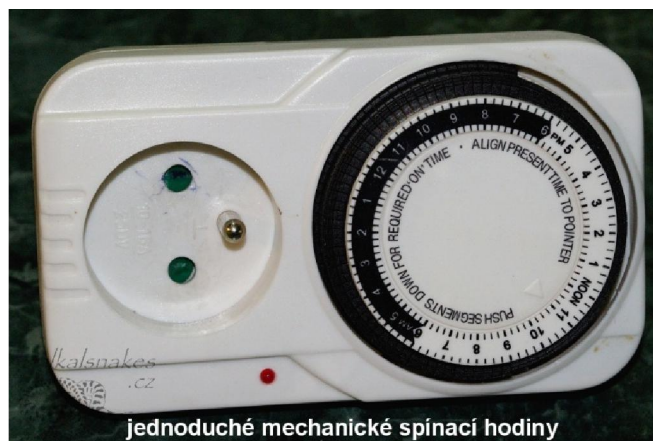
jednoduché mechanické spínací hodiny

Jak již bylo řečeno, je velice dobré řídit dobu osvitů i topení jednoduchými spínacími hodinami, popřípadě můžete použít i regulátor teploty.