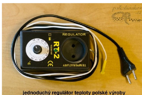
jednoduchý regulátor teploty polské výroby