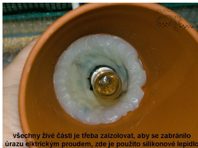
všechny živé části je třeba zaizolovat, aby se zabránilo úrazu elektrickým proudem, zde je použito silikonové lepidlo

Já v teráriu používám hliněný květináč a v něm obyčejnou nebo halogenovou žárovku ve tvaru svíčky se závitem E 14 (miňon závit). V této kategorii závitu se dá sehnat i nižší watáž, již od 15 W (ideální jsou žárovky, které se používají do pečící trouby, vyrábějí se 15 a 25W a déle vydrží, jsou určeny pro vysoké teploty).