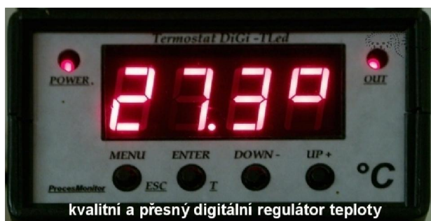
kvalitní a přesný digitální regulátor teploty

Vybudujte v teráriu jednoduchý úkryt. Opět není třeba kupovat drahé výrobky z obchodu, stačí kousek kůry, rozříznutá skořápka od kokosového ořechu, rozpůlený hliněný květináč, převrácená keramická miska, kde vyříznete dostatečně velký vstup. Nedávejte do terária žádné složité úkryty, pak bývá velký problém hada z něj vytáhnout. Mnohem jednodušší je úkryt nadzvednout a mít k němu okamžitý přístup. Úplně nejlepší jsou dva úkryty. Jeden umístěte blíže k tepelnému zdroji a druhý dejte na chladnější místo.